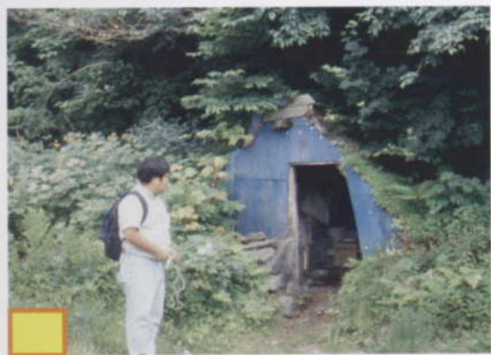
⑤ 見倉 (秋山郷 津南町)