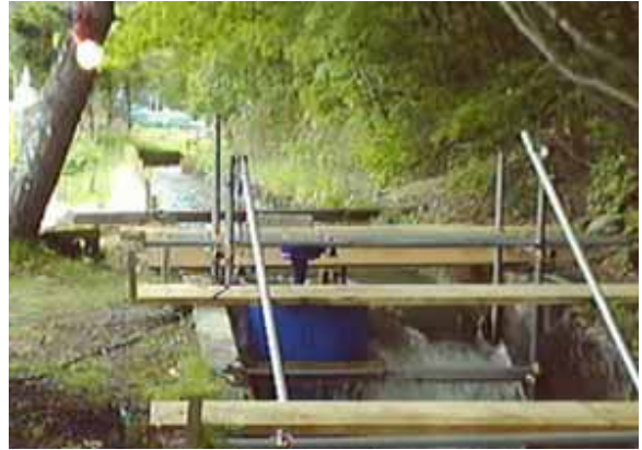
自前で電灯を点けています(^_^);

沢発電所の様子を心配して現地に集まったり、電話連絡したりと慌しい場面もありました。しかし、土地改良区で水量調整されたこともあり、大きな問題はありませんでした。